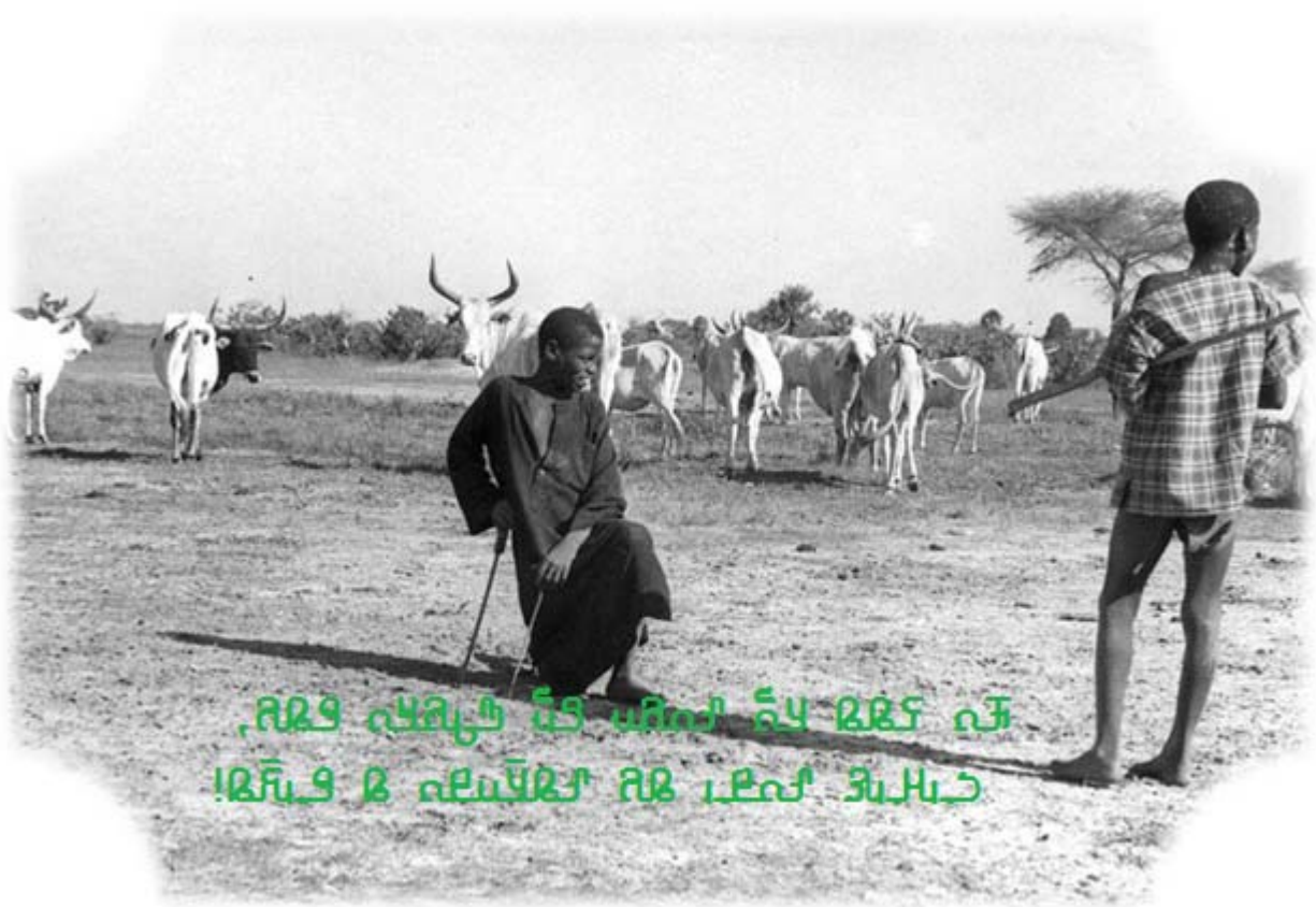
අප්‍රිකානු ගව ජනතාවගේ ජීවිතයේ ස්වභාවය සහ ජීවන රටාවන් පිළිබඳව විස්තරයක්

අප්‍රිකානු ගව ජනතාවගේ ජීවිතයේ ස්වභාවය සහ ජීවන රටාවන් පිළිබඳව විස්තරයක්. ගව ජනතාවගේ ජීවිතයේ ස්වභාවය සහ ජීවන රටාවන් පිළිබඳව විස්තරයක්. ගව ජනතාවගේ ජීවිතයේ ස්වභාවය සහ ජීවන රටාවන් පිළිබඳව විස්තරයක්.