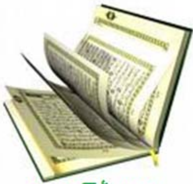
සමාජ සේවය අපගේ වගකීම